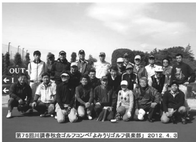
第75回川調春秋会ゴルフコンペ「よみうりゴルフ倶楽部」2012. 4. 3